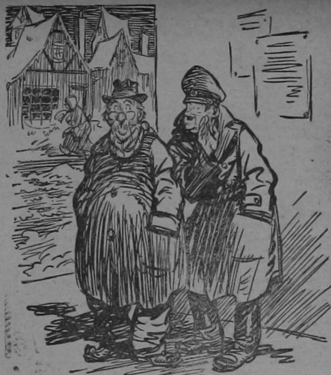
"Cuales son los últimos rumores que circulan sobre Hitler?"