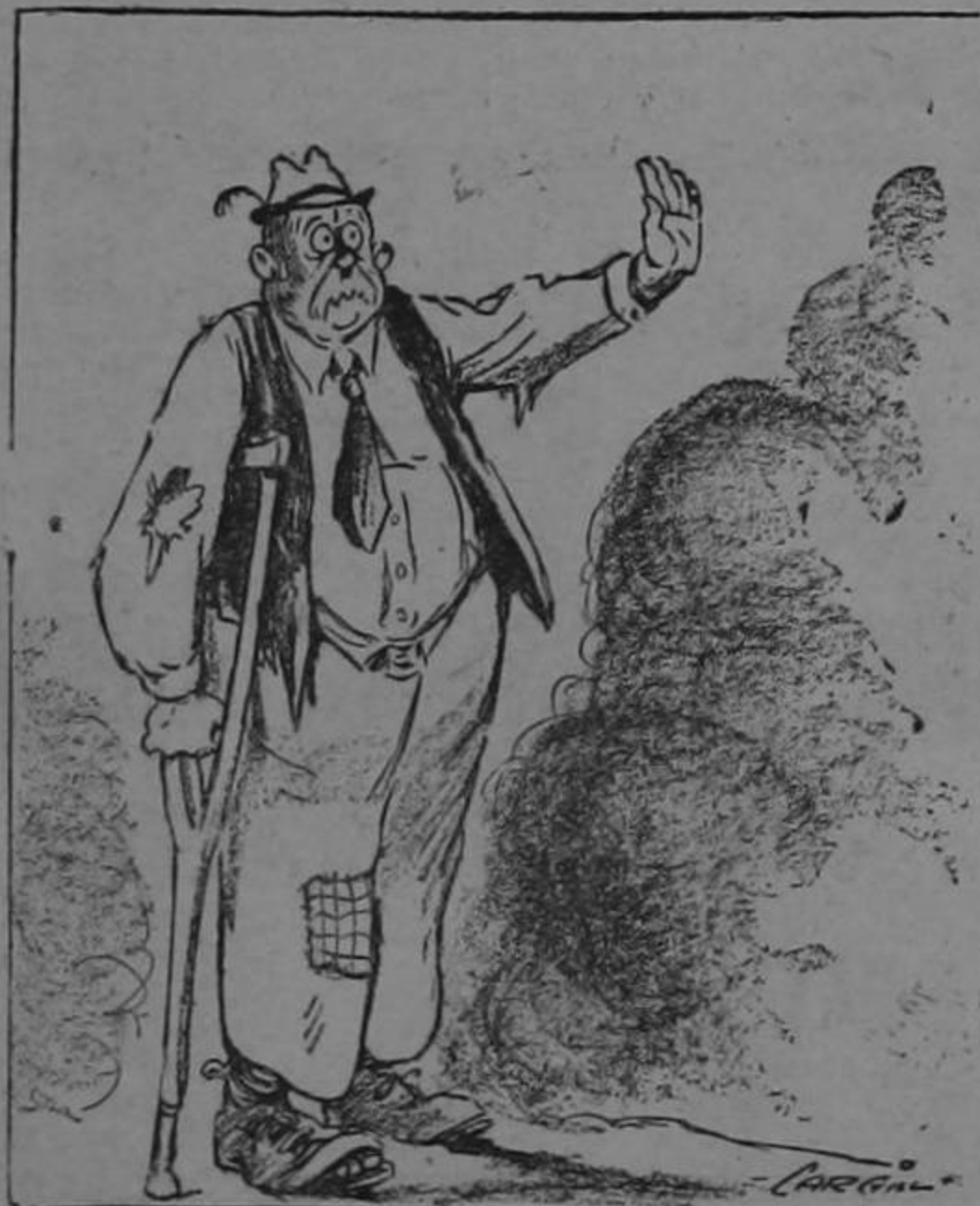
EL NUEVO AMO?