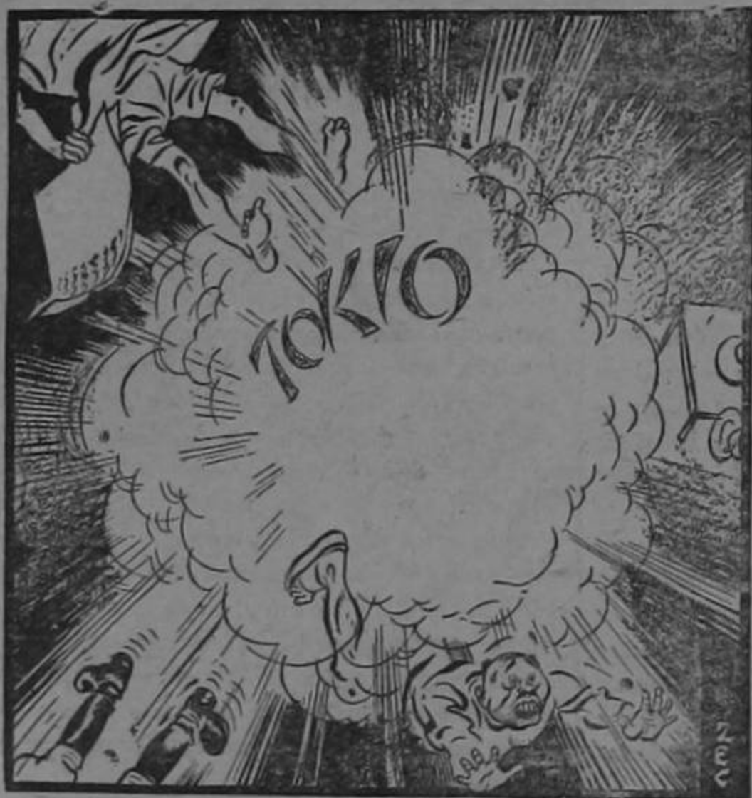
EXPLOSIONES EN EL ORIENTE

Eres una vaca lechera que alimenta a todos siempre con buenos modos y con buena manera.